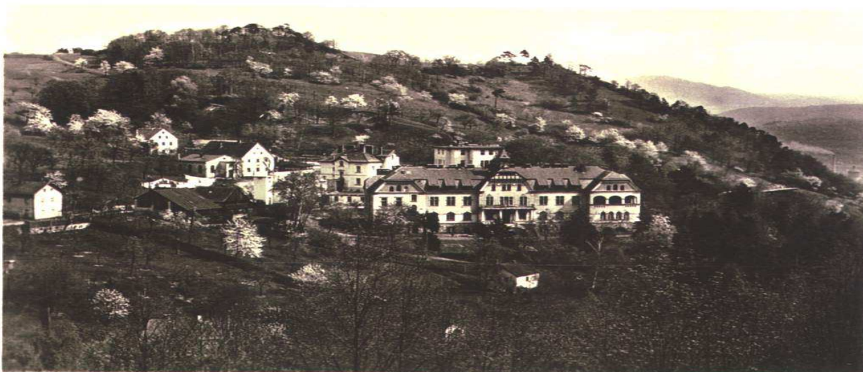
(pohled do historie)

Dále je v areálu budova údržby – prádelny - šatny, kinosál, vrátnice, 2 vilky – ubytovny. Domek pro zaměstnance č.p. 34 byl k 1.1.2014 převeden na Krajskou majetkovou s.r.o. včetně nájemního domu č.p. 3, který je navržen v rámci investičního záměru k demolici.